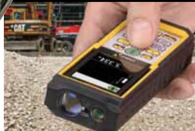
Robustes, schlagfestes Gehäuse mit stoßabsorbierendem Softgrip-Mantel.