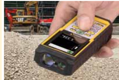
STABILA Laser-Entfernungsmesser Type LD 500