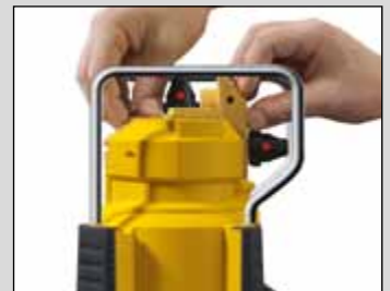
Wechsel von der Horizontal- in die Vertikalposition: Die komplette Prismeneinheit wird im Führungskanal um 90° präzise geschwenkt.