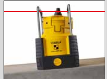
Schwenkbares Oberteil: Bequeme Geländeanpassung.

Bei Lasergeräten der Klasse 2 ist das Auge bei zufälligem kurzzeitigem Hineinschauen in die Laserstrahlung durch den Lidschlussreflex und/oder Abwendreaktionen geschützt. Diese Geräte dürfen deshalb ohne weitere Schutzmaßnahmen eingesetzt werden. Trotzdem sollte man nicht in den Laserstrahl blicken.