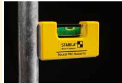
STABILA Pocket PRO Magnetic