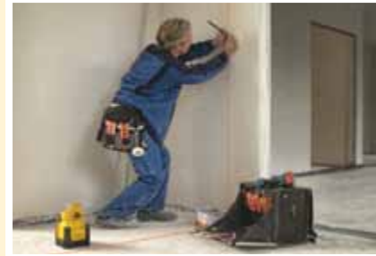
STABILA Pendel-Rotations-Laser Type LAPR 150

Präzision zahlt sich aus. Sofort und dauerhaft.