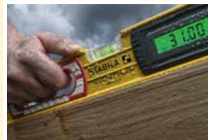
STABILA Type 196-2 electronic IP 65: staub- und wassergeschützt

PRÄZISE. ROBUST. ZUVERLÄSSIG. LEICHTE BETRIEBUNG.